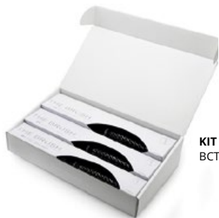
KIT 3 BCTK3

La ligne de brosses la plus éblouissante est née. Une combinaison explosive entre le titane et les poils thermochromiques lui confère le podium dans les salons de coiffure. Vous trouverez la dernière gamme de brosses conçue par Corioliss en 3 tailles pour tous les besoins de coiffure.