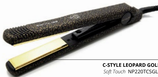
C-STYLE LEOPARD GOLD Soft Touch NP220TCSGLS