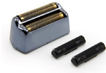
LAME DE REMPLACEMENT TCTSBSR

Le rasoir est le nouvel outil de Corioliss, puissant et silencieux, doté d'un moteur rotatif à courant continu haute performance. Il est conçu pour répondre à toutes les attentes des professionnels en matière de rasage.