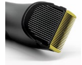
CLIPPER CRS-201 - BLACK METAL EDITION TCCCRS201BME