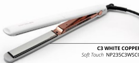
C3 WHITE COPPER Soft Touch NP235C3WSCO