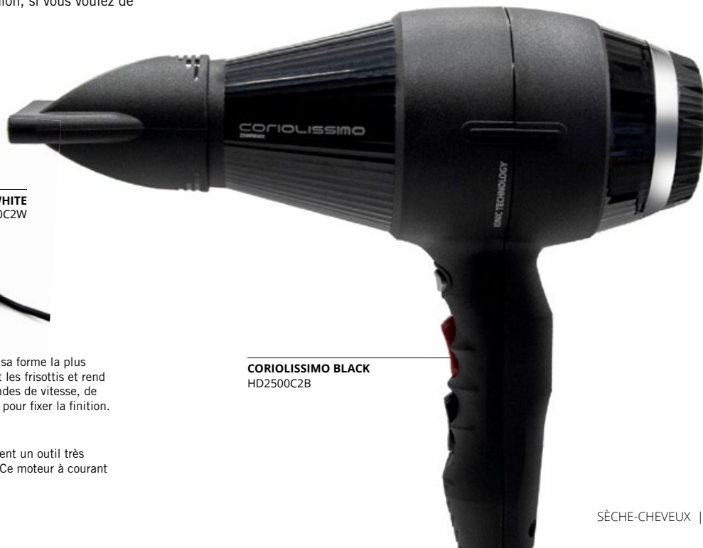
CORIOLISSIMO BLACK HD2500C2B

C'est un sèche-cheveux pour les professionnels qui veulent un outil très puissant et performant qui réduit le temps de séchage. Ce moteur à courant alternatif est la star des coiffures explosives.