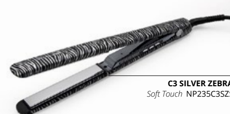
C3 SILVER ZEBRA Soft Touch NP235C3SZS