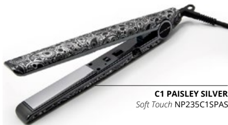
C1 PAISLEY SILVER Soft Touch NP235C1SPAS