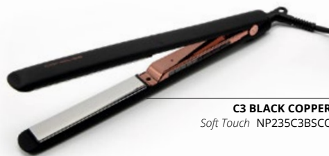
C3 BLACK COPPER Soft Touch NP235C3BSCO