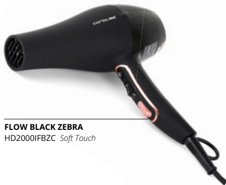
FLOW BLACK ZEBRA HD2000IFBZC Soft Touch

Ce sèche-cheveux professionnel est un pur produit de luxe. Non seulement son design est spectaculaire, mais ses caractéristiques techniques en font le premier de sa catégorie : moteur super puissant, débit d'air élevé et grande vitesse de séchage pour des heures et des heures de fonctionnement.