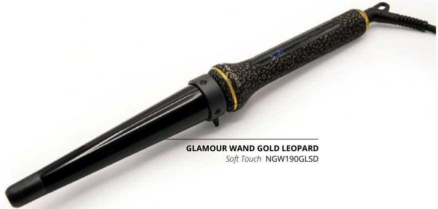
GLAMOUR WAND GOLD LEOPARD Soft Touch NGW190GLSD