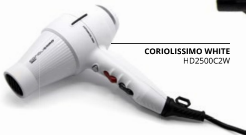
CORIOLISSIMO WHITE HD2500C2W

Ce sèche-cheveux est une pure puissance. Le moteur Corioliss le plus robuste et le plus puissant fournit 2500 W pour sécher vos cheveux en un temps record. C'est un incontournable du salon, si vous voulez de la puissance et du débit très élevé, prenez-le !