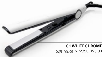
C1 WHITE CHROME Soft Touch NP235C1WSCH