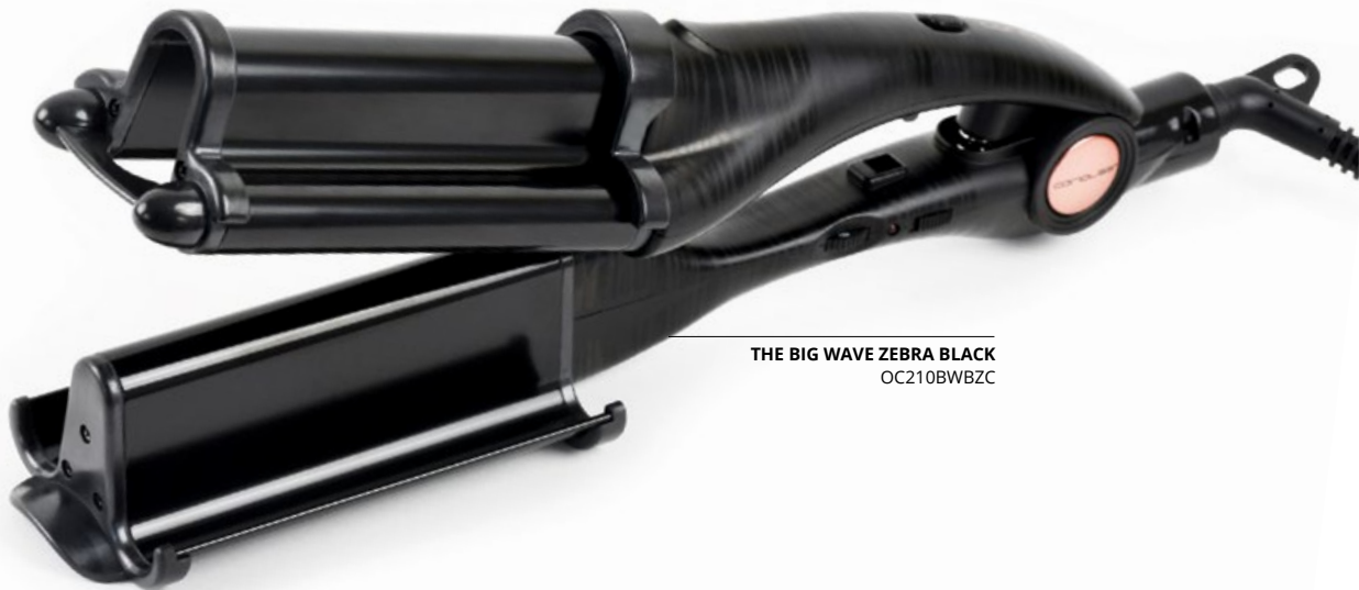
THE BIG WAVE ZEBRA BLACK OC210BWBZC

Si vous aimez les vagues larges dans le style hollywoodien vous avez votre meilleur allié. Il est conçu pour créer du corps, du mouvement et de la texture. De plus, le volume à la racine est assuré !