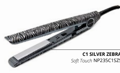
C1 SILVER ZEBRA Soft Touch NP235C1SZS