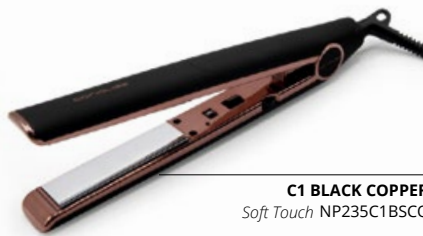
C1 BLACK COPPER Soft Touch NP235C1BSCO