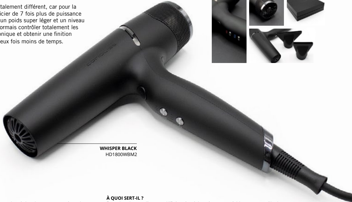
WHISPER BLACK HD1800WBM2

Ce nouveau sèche-cheveux est totalement différent, car pour la première fois, vous pouvez bénéficier de 7 fois plus de puissance que les autres concurrents, avec un poids super léger et un niveau sonore très bas. Vous pouvez désormais contrôler totalement les frisottis grâce à son générateur ionique et obtenir une finition digne d'un salon de coiffure en deux fois moins de temps.