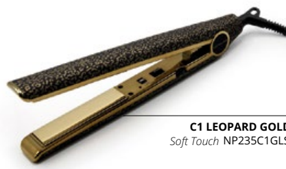
C1 LEOPARD GOLD Soft Touch NP235C1GLS