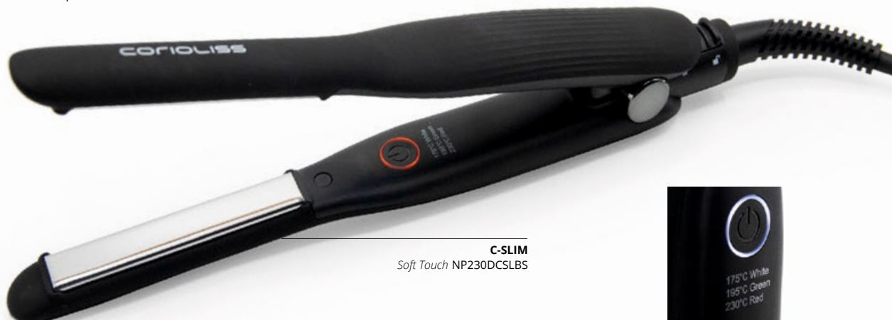
C-SLIM Soft Touch NP230DCSLBS

Notre C-SLIM est l'outil idéal pour les cheveux courts, les retouches et les zones difficiles à atteindre. Grâce à ses plaques étroites et à sa taille compacte, vous pouvez facilement coiffer vos cheveux, même dans les endroits les plus difficiles d'accès. Qu'il s'agisse de lisser, de boucler ou d'onduler, notre lisseur offre la précision et le contrôle dont vous avez besoin pour obtenir le look désiré.