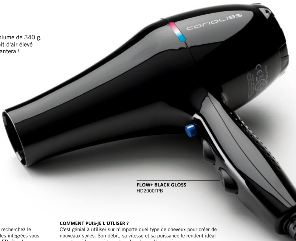
FLOW+ BLACK GLOSS HD2000FPB

FLOW + est conçu avec un puissant moteur DC de 2000W. Si vous recherchez le confort et la légèreté, vous êtes face au choix parfait. Les commandes intégrées vous permettent de choisir entre 2 vitesses et 2 températures affichage LED. De plus, vous pouvez sélectionner l'air froid avec un bouton conçu pour cela. Son câble mesure 2,8 mètres de long, préparé pour le salon et contient 2 embouts diffuseurs.