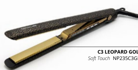
C3 LEOPARD GOLD Soft Touch NP235C3GLS