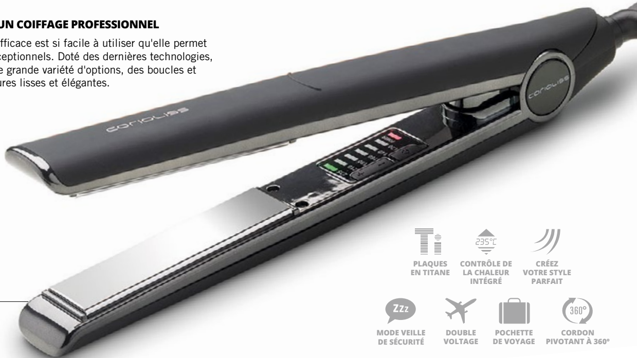
C1-DIGITAL BLACK NP235C1DBSS Soft Touch

La conception simple et efficace est si facile à utiliser qu'elle permet d'obtenir des résultats exceptionnels. Doté des dernières technologies, ce fer permet de créer une grande variété d'options, des boucles et des ondulations aux coiffures lisses et élégantes.