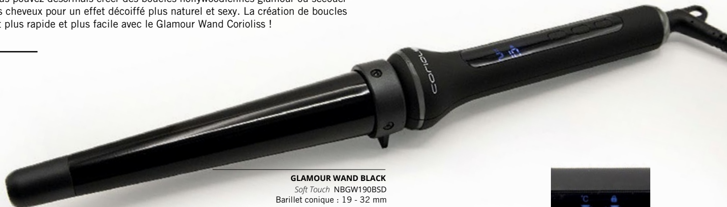
GLAMOUR WAND BLACK Soft Touch NBGW190BSD Barillet conique : 19 - 32 mm

Vous pouvez désormais créer des boucles hollywoodiennes glamour ou secouer vos cheveux pour un effet décoiffé plus naturel et sexy. La création de boucles est plus rapide et plus facile avec le Glamour Wand Corioliss !