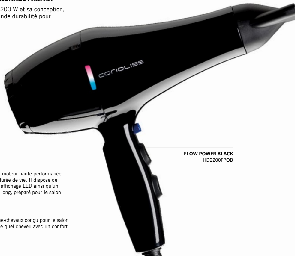
FLOW POWER BLACK HD2200FPOB

Son moteur AC solide d'une puissance de 2200 W et sa conception, en font la solution professionnelle d'une grande durabilité pour un séchage rapide et parfait.