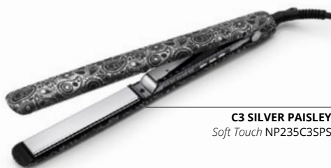
C3 SILVER PAISLEY Soft Touch NP235C3SPS