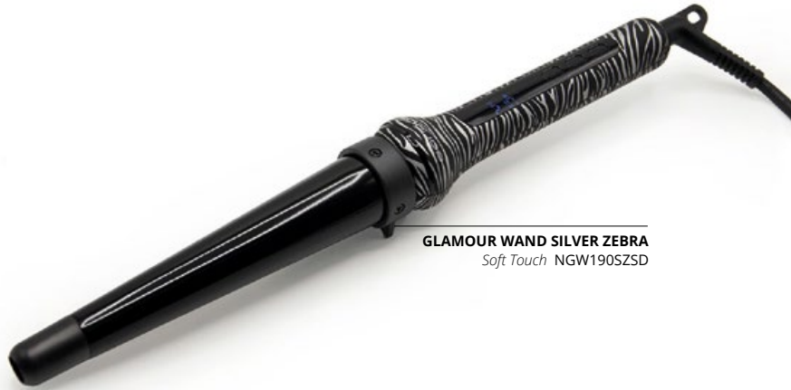
GLAMOUR WAND SILVER ZEBRA Soft Touch NGW190SZSD