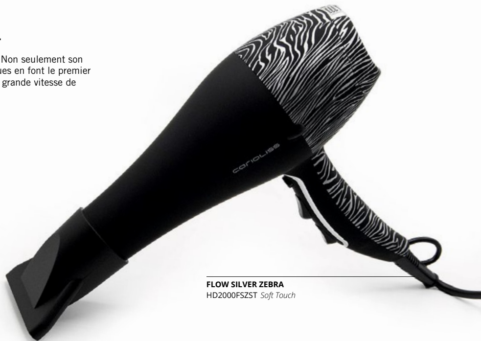
FLOW SILVER ZEBRA HD2000FSZST Soft Touch