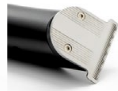
TRIMMER CRS-101 - BLACK METAL EDITION TTCRS101BME