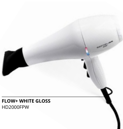
FLOW+ WHITE GLOSS HD2000FPW

Ses caractéristiques les plus importantes sont son poids plume de 340 g, ce qui le rend unique pour le confort de séchage, son débit d'air élevé et sa vitesse. De plus, son faible niveau sonore vous enchantera !