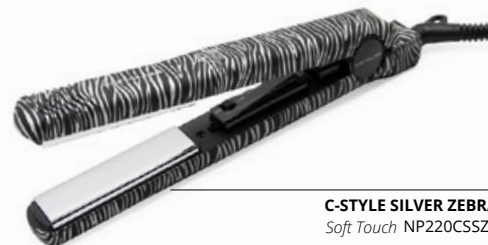
C-STYLE SILVER ZEBRA Soft Touch NP220CSSZS