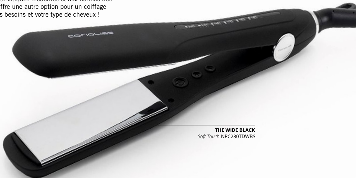
THE WIDE BLACK Soft Touch NPC230TDWBS

Le fer à coiffer Corioliss WIDE a été conçu avec des plaques plus larges et plus longues. Grâce à ses caractéristiques modernes et aux normes des salons de coiffure, le WIDE vous offre une autre option pour un coiffage professionnel, quels que soient vos besoins et votre type de cheveux !