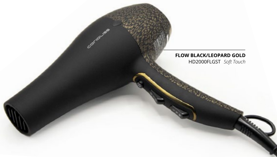
FLOW BLACK/LEOPARD GOLD HD2000FLGST Soft Touch