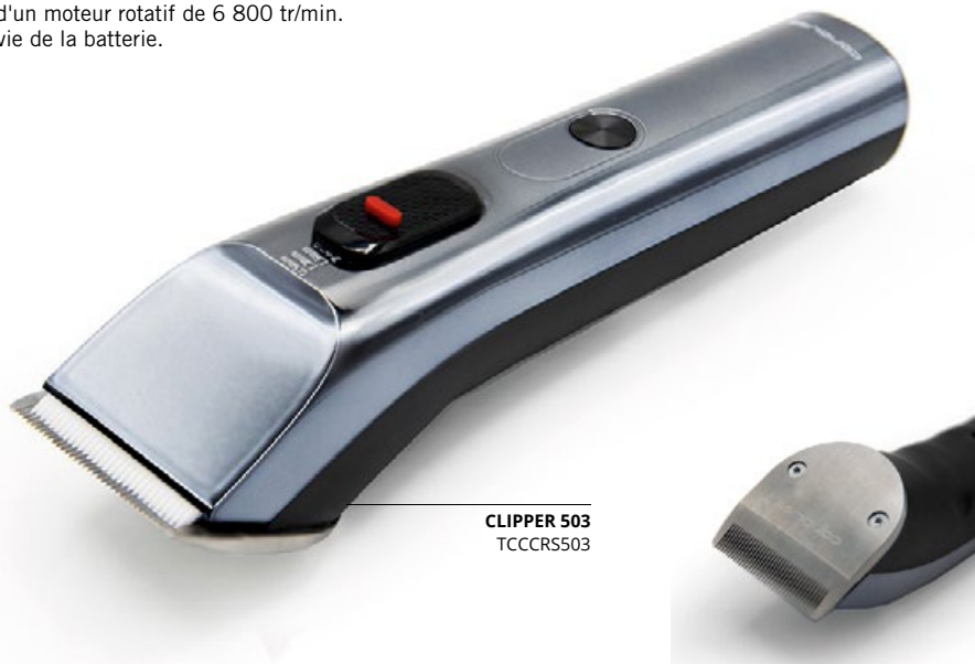
CLIPPER 503 TCCCR503