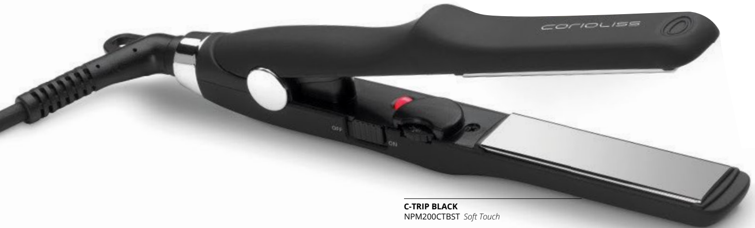
C-TRIP BLACK NPM200CTBST Soft Touch

Ne vous fiez pas à sa taille, cette merveille discrète est un outil tout-terrain. En quelques minutes, vous obtenez le lissage express d'un salon de coiffure, avec un maximum de douceur et de brillance... et zéro frisottis pendant des heures !