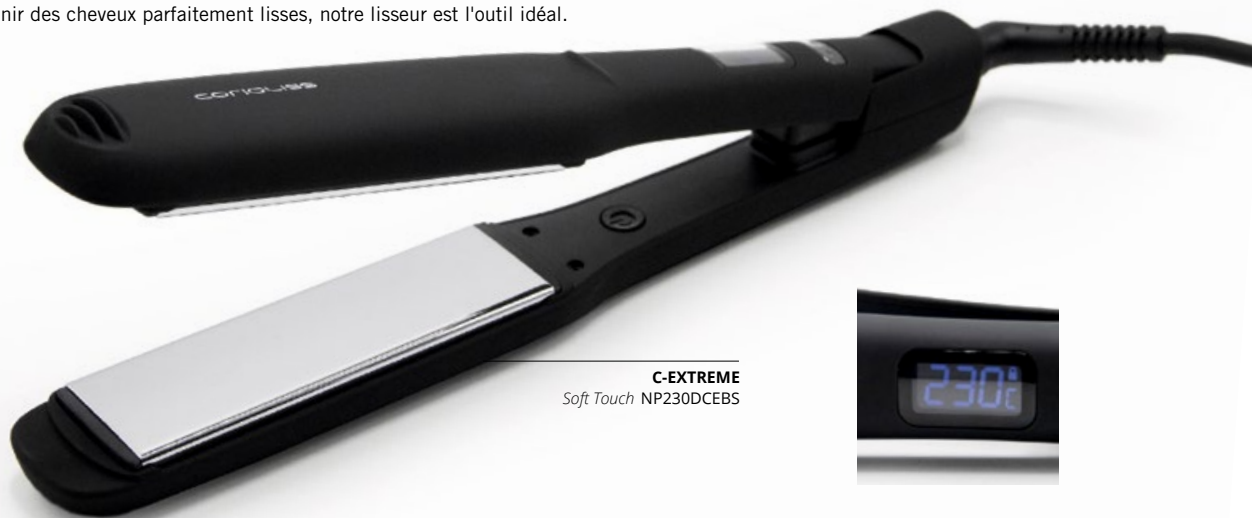
C-EXTREME Soft Touch NP230DCEBS

Notre fer à lisser C-EXTREME à plaques extra-larges et extra-longues est spécialement conçu pour les traitements à la kératine. Avec ses réglages de température et ses plaques en titane, ce lisseur respecte vos cheveux tout en renforçant les effets de votre traitement. Les plaques plus larges permettent également de couvrir plus de cheveux à la fois, ce qui réduit le temps nécessaire pour les coiffer. Que vous souhaitiez réaliser ou entretenir votre traitement à la kératine ou simplement obtenir des cheveux parfaitement lisses, notre lisseur est l'outil idéal.