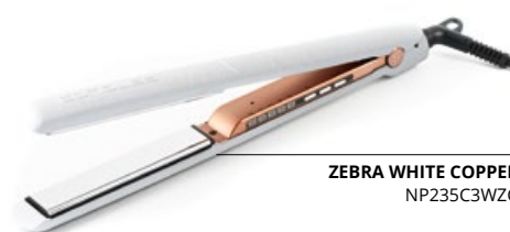
ZEBRA WHITE COPPER NP235C3WZC