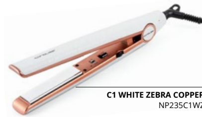
C1 WHITE ZEBRA COPPER NP235C1WZ