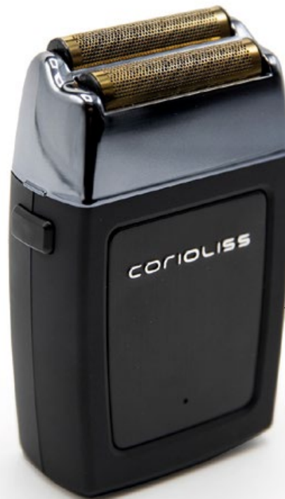
THE SHAVER TCTSBS