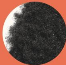
Curl type 7 CRÉPU