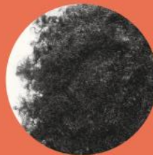
Curl type 6 TRÈS FRISÉ