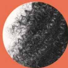
Curl type 5 FRISÉ