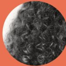
Curl type 4 TRÈS BOUCLÉ