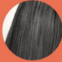
Curl type 1 LISSÉ