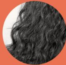
Curl type 3 BOUCLÉ