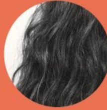
Curl type 2 ONDULÉ